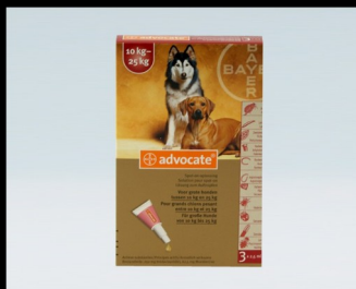
Advocate pipetjes tegen vlooiën, teken en wormen