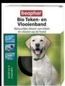
Beaphar bio teken -en vlooiënband